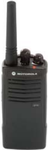
Modelo EP150 UHF