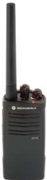
Modelo EP150 VHF

Con un peso de solo 244 g (8.6 onzas), el EP150 es cómodo para usar durante todo el día. Además, la interfaz del usuario simplifica y facilita el uso del radio con poca o ninguna capacitación.